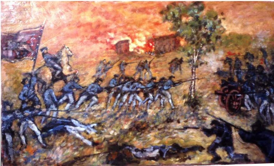
4 20 avril 1797. L'armée Vénéto-Scaligère engage le combat à san Massimo et à santa Lucia. Pour la dernière fois la victoire sourit aux soldats de saint Marc. Détrempe de Quirino Maestrello.