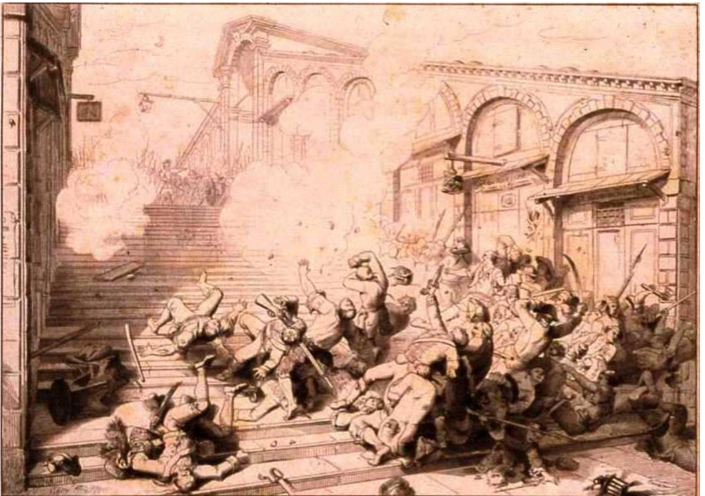
5 Derniers moments de la République Venitienne: pour ne pas déplaire à Bonaparte, le Sénat ordonne de suffoquer dans le sang le tumulte populaire éclaté en défense de saint Marc. C'est le 12 mai 1797. G.I. Gatteri et G. Bernasconi. D'après le volume: Histoire venitienne, représentée en 150 planches inventées et dessinées par Giuseppe Gatteri, suivant les diverses coutumes. IIe édition. Venise, 1854. Bibliothèque du Civique Musée Correr.