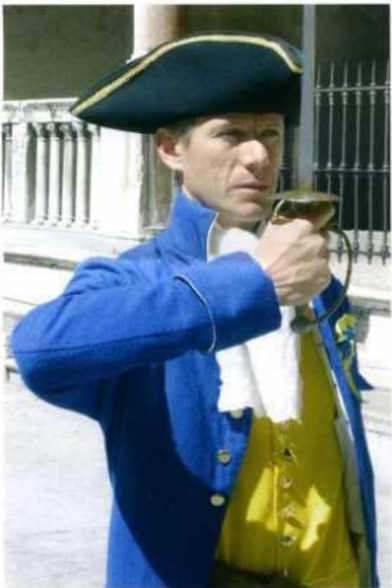
3 La garde noble portait l'uniforme aux couleurs de Vérone et défendait jours et nuits les portes de la cité de l'attaque des jacobins bergamasques et brescians. En signe de patriotisme et d'aversion à la révolution française, hommes du peuple et autorités épinglaient sur leurs vestes ou sur leurs chapeaux une cocarde jaune-bleu clair.