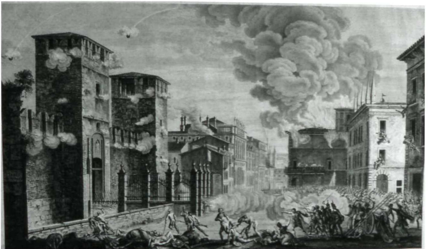
2 Pâques Véronaises: assaut du peuple véronais à la forteresse de Castelvecchio, où s'étaient retranchées les ordes de Bonaparte. Estampe française de l'époque du Duplessis-Bertaux. Vérone, Musée de la Renaissance, près de la Bibliothèque d'art du Musée de Castelvecchio.