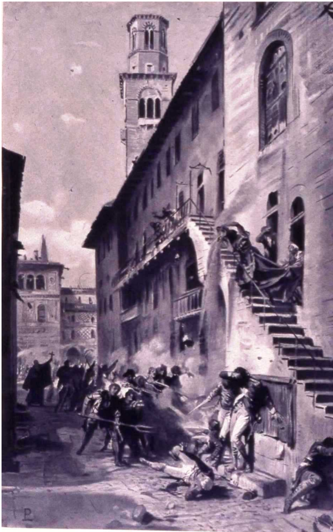
6. Les Pâques Véronaises. Rue Mazzanti a été le théâtre des premiers combats. Sur le fond, la Tour des Lamberti. Incision photomécanique d'après le dessin de Ludovico Pogliaghi et Francesco Bertolini. Le XVIII e siècle et le premier Royaume d'Italie, Milan, 1913. F.lli Treves, Editeurs, Milan, Musée de l'Histoire de la Renaissance.